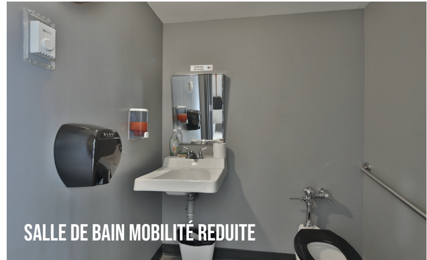
SALLE DE BAIN MOBILITÉ REDUITE