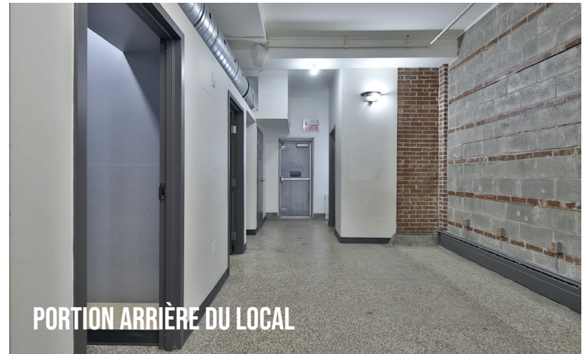
PORTION ARRIÈRE DU LOCAL