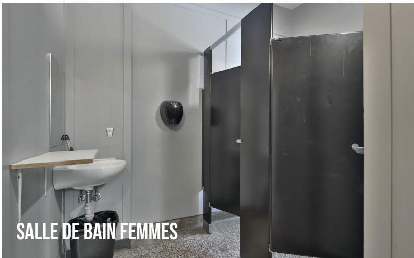
SALLE DE BAIN FEMMES