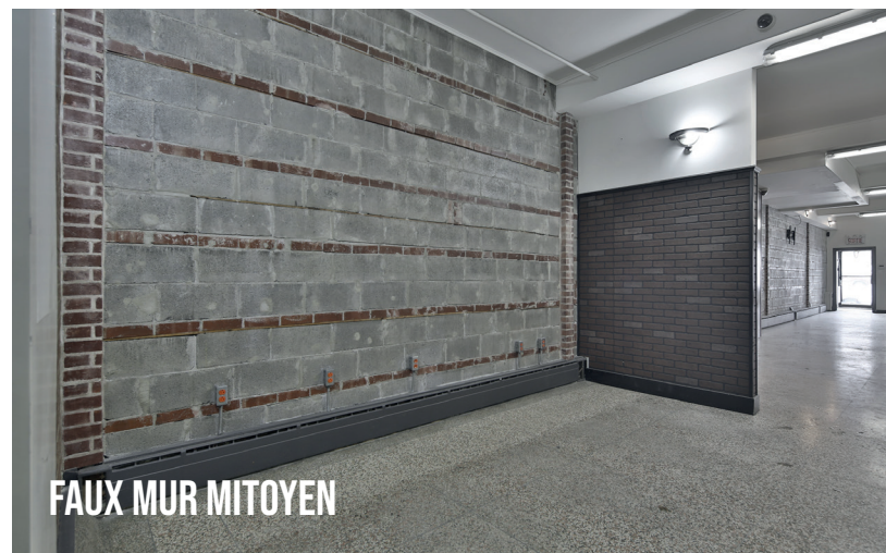
FAUX MUR MITOYEN