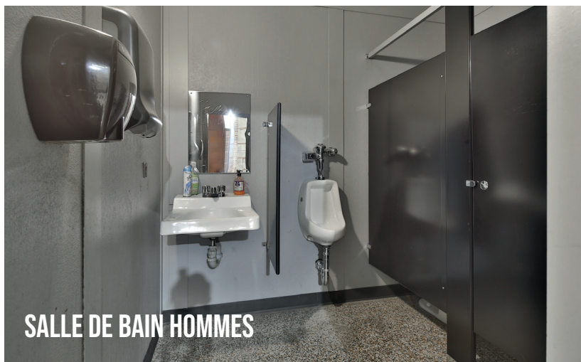
SALLE DE BAIN HOMMES