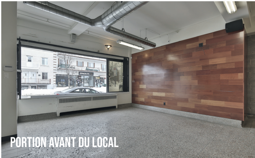
PORTION AVANT DU LOCAL